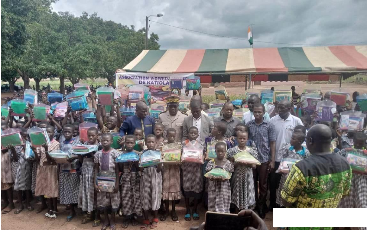
Schulkinder bei der Schulsets Austeilung mit den Regions- Ortsvertretern und Schulleitern in Karakoro