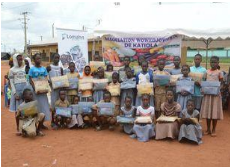
Schulkinder mit den geschenkten Schulsets in Katiola