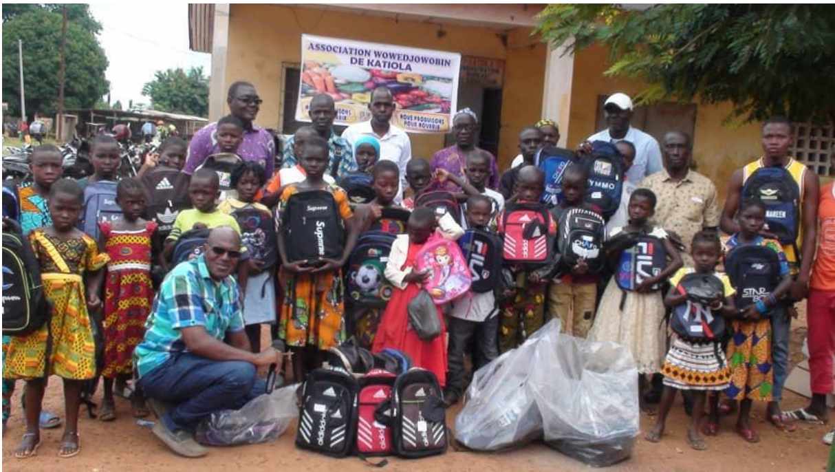
Schulkinder bei der Schulsets Austeilung mit unserem Vertreter in Katiola