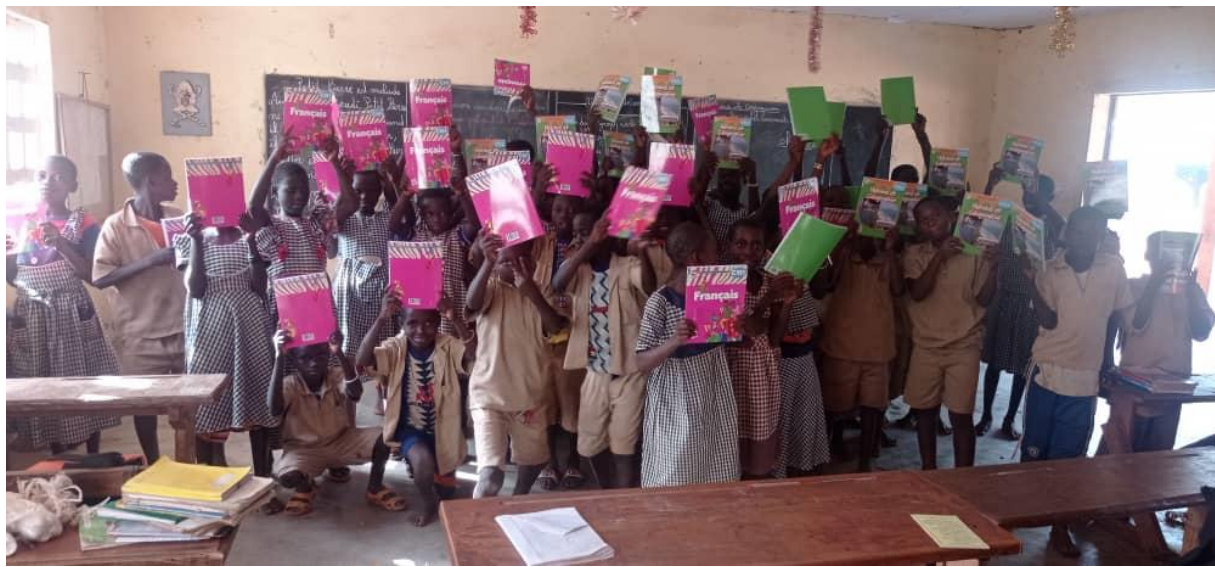
Schulkinder mit den Büchern von den geschenkten Schulsets in ihrer Klasse