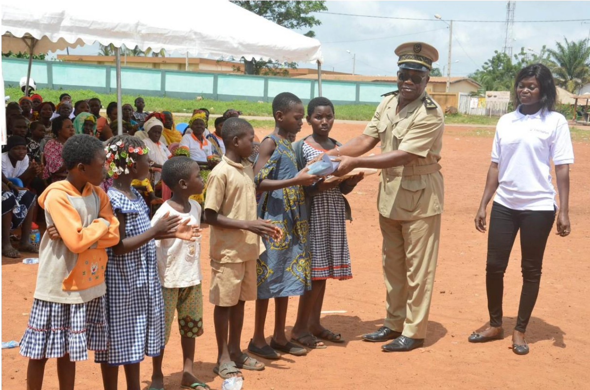
Schulkinder bei der Schulsets Austeilung mit den Regions- und Ortsvertretern in Katiola